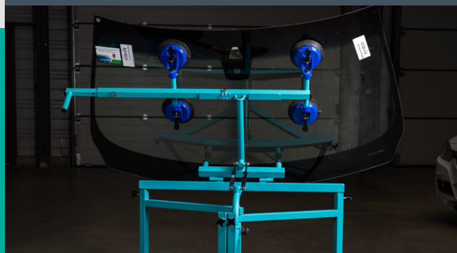
TABLE DE RETOURNEMENT