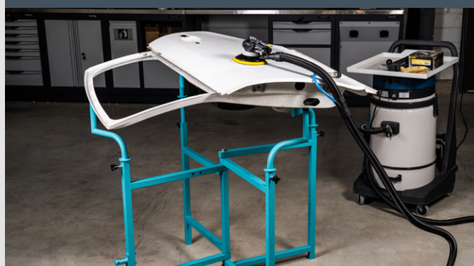
TABLE DE PRÉPARATION DE CARROSSERIE